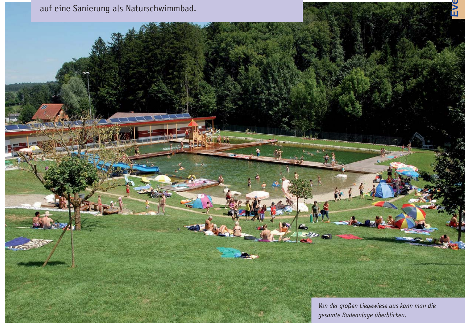
Von der großen Liegewiese aus kann man die gesamte Badeanlage überblicken.

In der Gemeinde Eggersdorf bei Graz (Steiermark/Österreich) war die Ausgangssituation ähnlich wie in Türnitz: Für das alte Chlorbeckenbad aus den 1960er Jahren bestand dringend Sanierungsbedarf. Die Entscheidung fiel nach längerer Diskussion schließlich auf eine Sanierung als Naturschwimmbad.