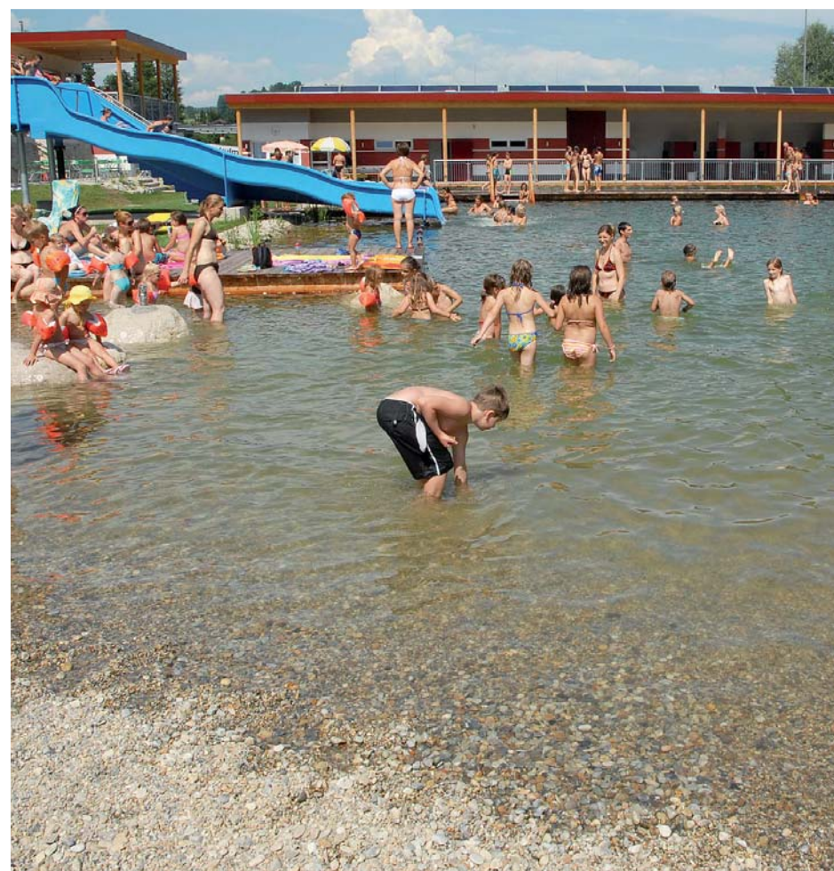
Nichtschwimmerbereich mit Flachuferzugang

Der neue Hochbau, für den das steirische Planungsbüro Herler & Partner verantwortlich zeichnet, umfasst einen Büffetbereich sowie Sanitär- und Technikräumlichkeiten sowohl für das Naturbad als auch für den angrenzenden Fußballplatz. Die höher gelegene, teilweise überdachte Terrasse bietet einen reizvollen Überblick über die vielfältig strukturierte Wasserfläche.