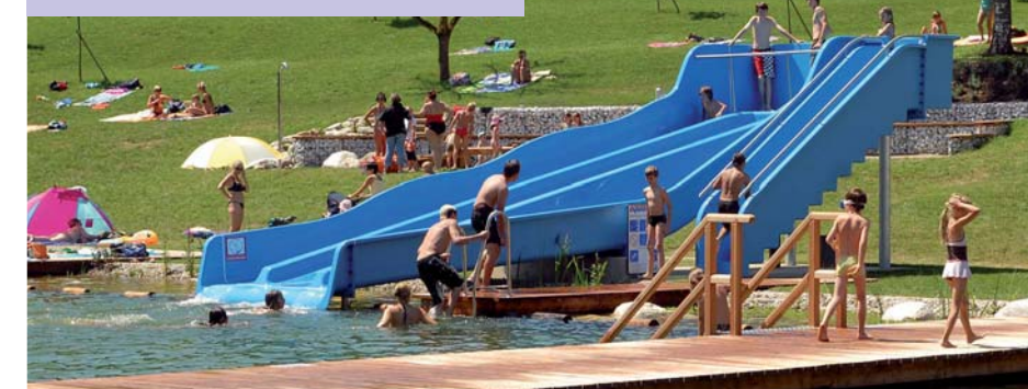
Die Trioslide Wasserrutsche