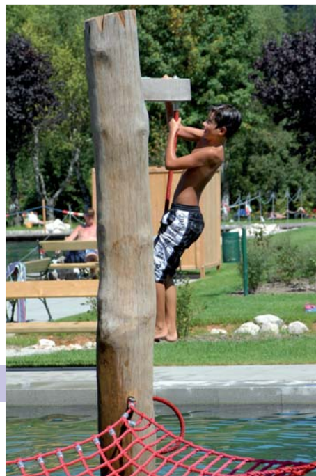
Eine besondere Attraktion: Klettern über Wasser

Das neu errichtete Betriebs- und Restaurantgebäude nimmt mit seinen beiden rechtwinklig zueinander angeordneten Baukörpern auf die örtlichen Gegebenheiten Rücksicht. Auch das Naturbad wurde auf zwei hydraulisch miteinander verbundene