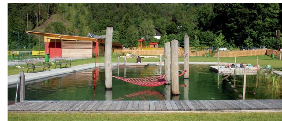
Schwimmteich & Naturpool 4-2009