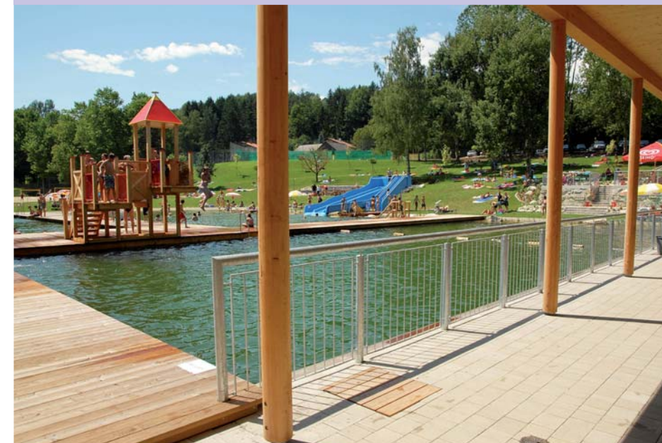
Der überdachte Gebäudeumgang des Umkleide- und Sanitärkomplexes grenzt direkt an den Sprungbereich.

Das alte Betonbecken dient heute als Nichtschwimmerbereich. Es wurde auf einer Schmalseite aufgebrochen und durch ein Flachufer mit Kiesstrand ergänzt. Eine neue Attraktion ist die Trioslide Wasserrutsche mit ihren drei Bahnen, welche ebenfalls in den Nichtschwimmerbereich mündet. Der Tiefbereich wird weiterhin als Sprungbecken genutzt. Neu hinzugekommen ist