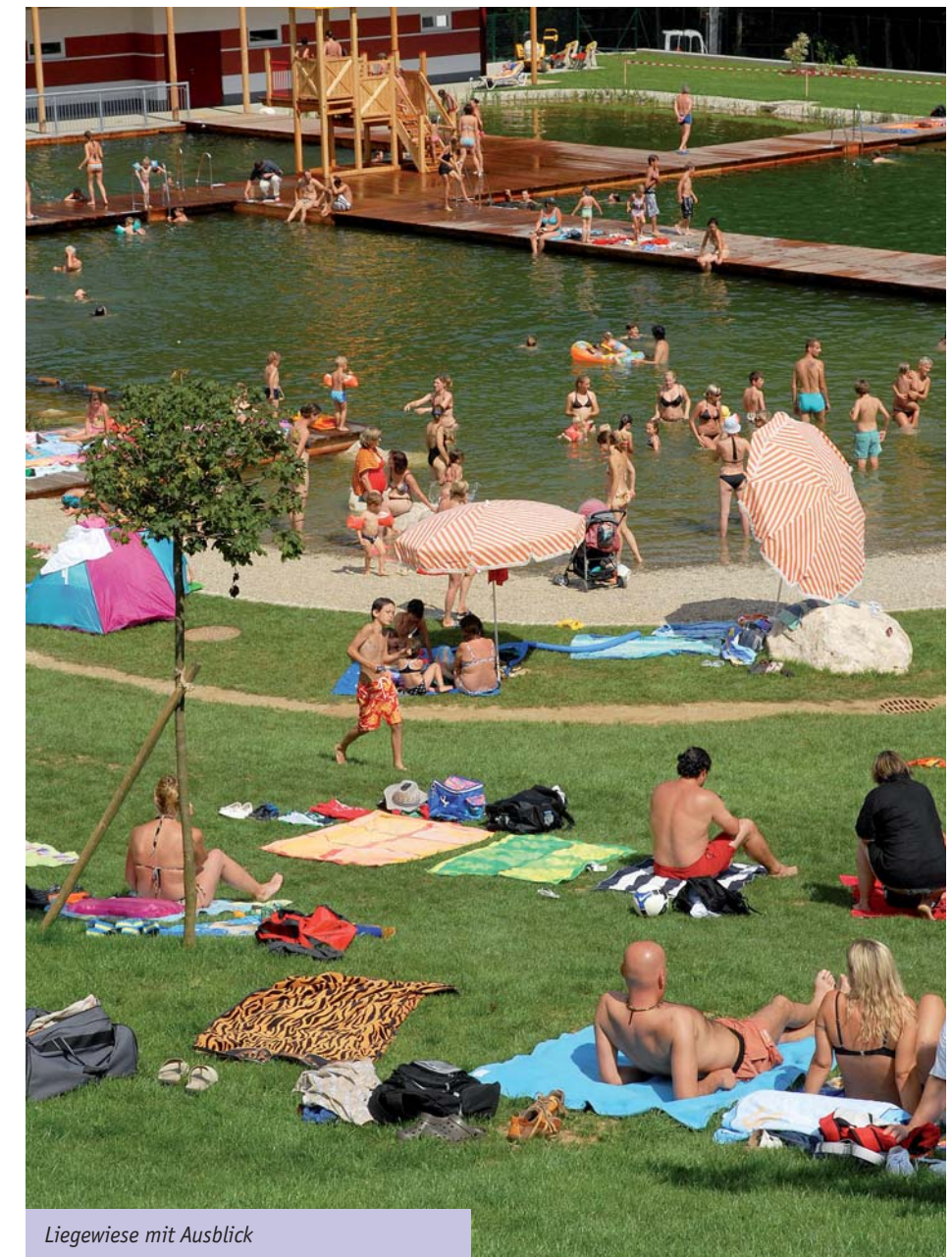
Liegewiese mit Ausblick