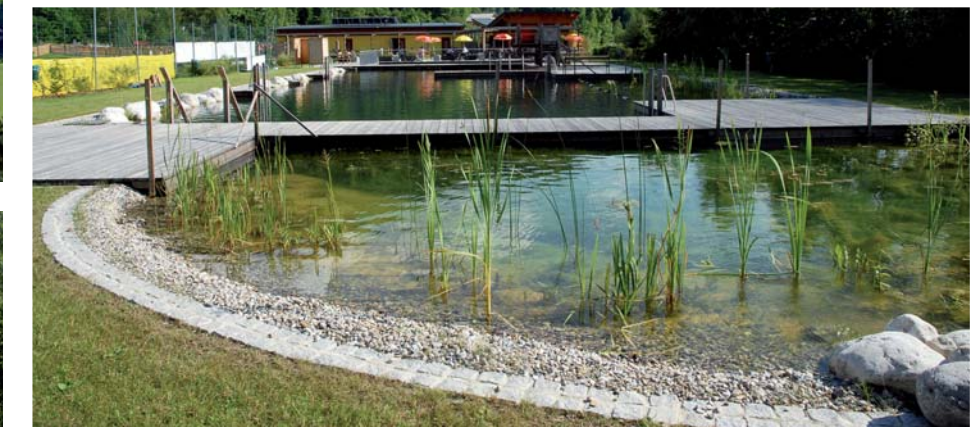
Eine klar ausgebildete Uferkante erleichtert die Rasenpflege