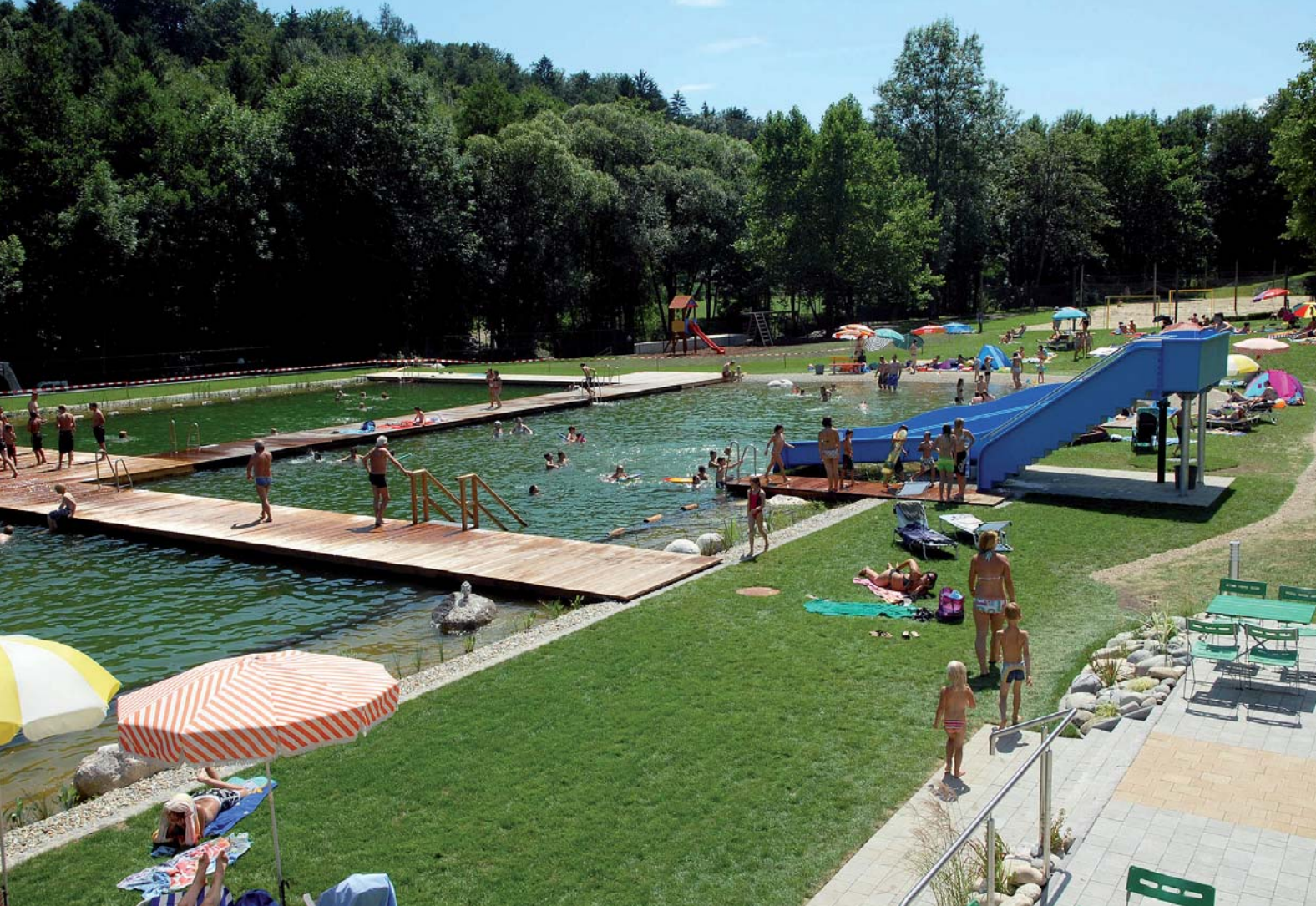
Blick von der überdachten Büffet-Terrasse auf die Badeanlage

ein 25-Meter-Sportbecken mit angrenzender Regenerationszone. Sämtliche Bereiche ergeben eine zusammenhängende Wasserfläche von knapp 2.300 m 2 .