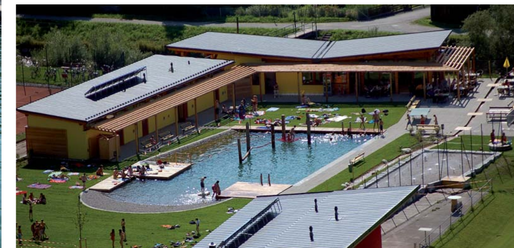
Das neue Betriebsgebäude mit Nichtschwimmerbereich, Kiesstrand und Seilklettergerät