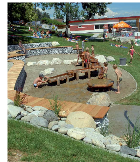
Der Sand- und Wasserspielplatz

Wagner & Weitlaner WasserWerkstatt OEG Salztorgasse 8/23 A-1010 Wien Tel. +43 (0) 1 - 3 10 48 78 office@wagner-weitlaner.at www.wasserwerkstatt.at Mitglied der Arbeitsgemeinschaft für Badeseen und Schwimmteiche (ABS) www.abs-naturbad.de