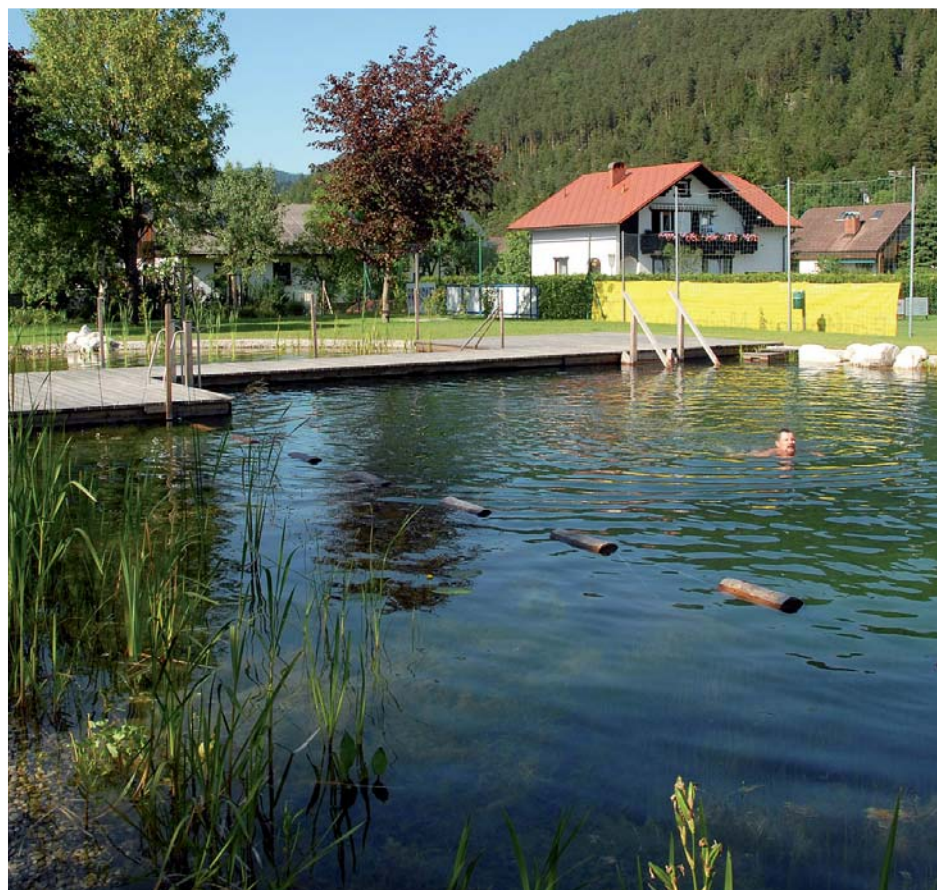
Deutlich sichtbare Abgrenzung zwischen Regenerationszone und Schwimmbereich

Übrigens: Der Namensgeber des Naturbades, der Scharbach, querte bislang unterirdisch in einer Verrohrung das Badgelände. Das Gerinne konnte im Zuge der Neugestaltung der Anlage wieder an die Oberfläche geholt werden. Im Bereich des Sandspielplatzes lässt sich Wasser mit Hilfe einer archimedischen Spirale aus dem Bach fördern. An den Wasserrinnen und dem Matschtisch können sich die Kinder dann so richtig austoben.