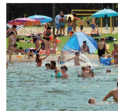
Der Nichtschwimmerbereich ist stets am meisten frequentiert.