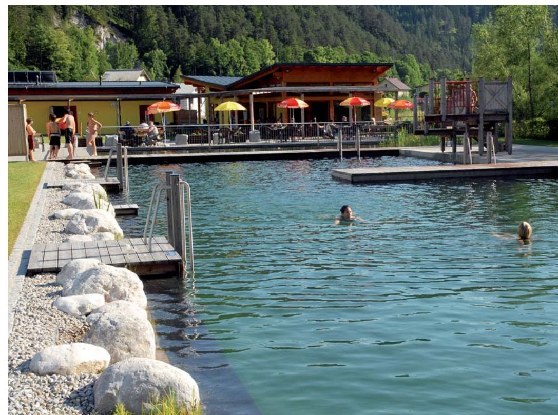
Schwimmbereich mit naturnaher Uferausbildung

Wasserflächen aufgeteilt. Die Gesamtwasserfläche beträgt circa 1.250 m 2 .